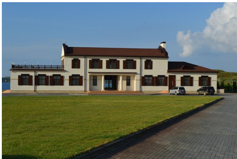
12. Научный центр Фанагорийской экспедиции (2016 г.)