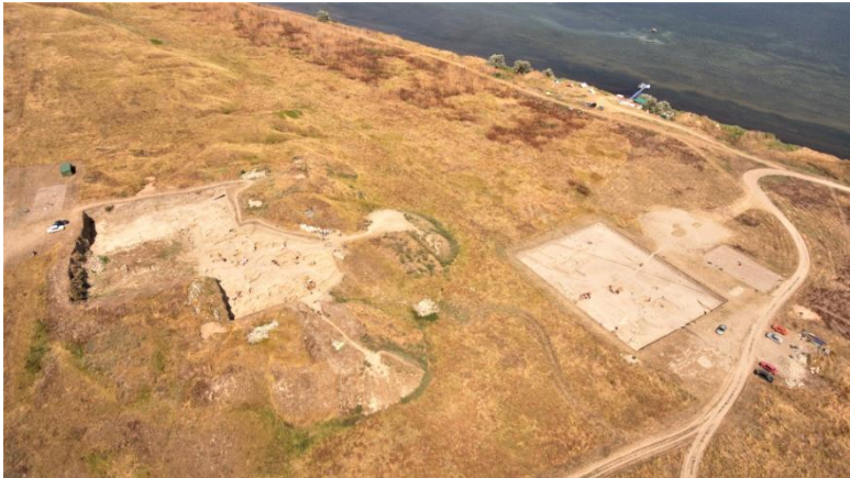
15. Вид на раскопки Фанагории (2017 г.)