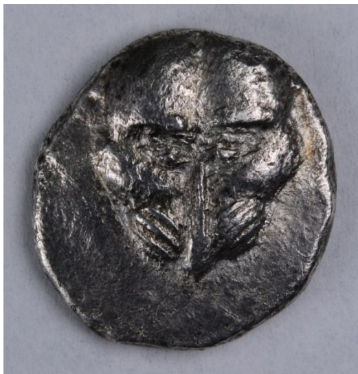
3. Аверс драхмы из клада, найденного в 2005 г. (научный центр Фанагорийской экспедиции, 2017 г.)