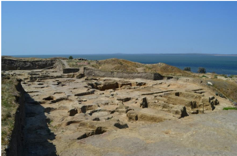
2. Раскоп «Верхний город» (2018 г.)