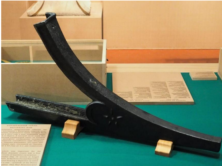
7. Таран с митридатовской символикой (выставка «Пантикапей и Фанагория», ГМИИ, 2017 г.)