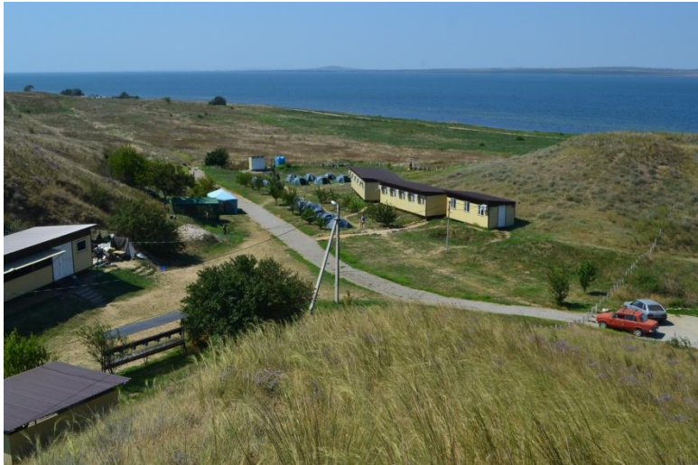
14. Лагерь Фанагорийской экспедиции (2018 г.)