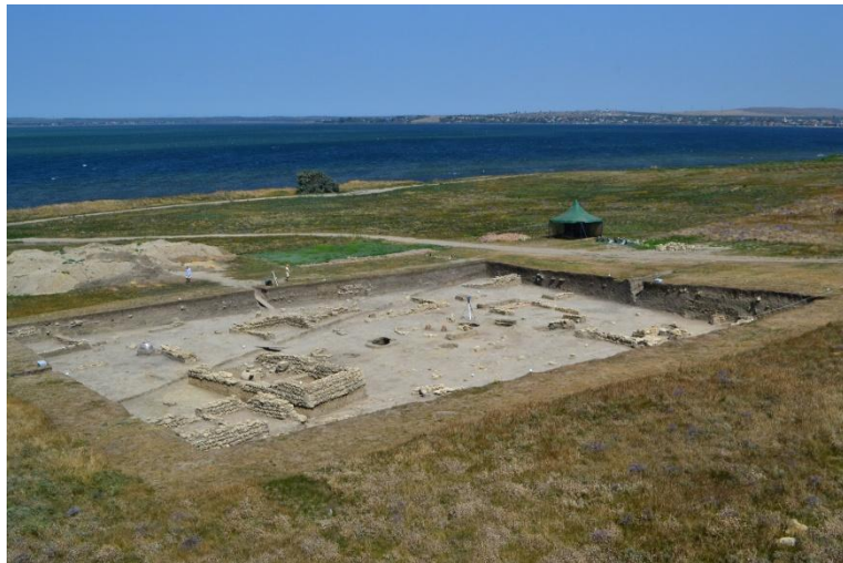
10. Раскоп «Нижний город» (2018 г.)