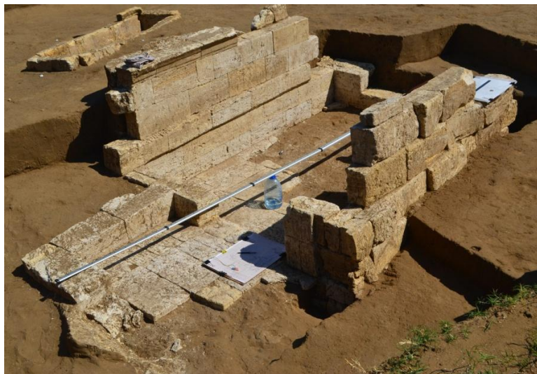
5. Гробница эллинистического времени на Западном некрополе (2018 г.)