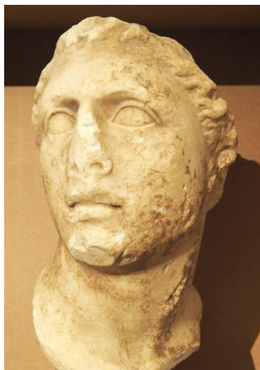
6. Портрет Митридата VI из Пантикапея (выставка «Пантикапей и Фанагория», ГМИИ, 2017 г.)