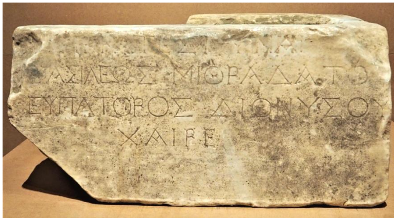
8. Постамент статуи Гипсикратии (выставка «Пантикапей и Фанагория», ГМИИ, 2017 г.)