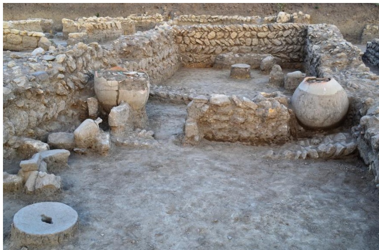
11. Здание хазарского времени на раскопе «Нижний город» (2018 г.)