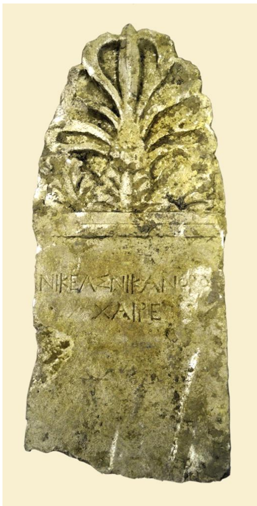
13. Надгробие Никея, сына Никанора (эпоха эллинизма), хранящееся в научном центре Фанагорийской экспедиции (2016 г.)