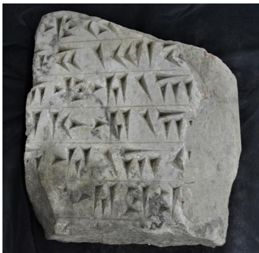
4. Клинописная надпись (научный центр Фанагорийской экспедиции, 2018 г.)